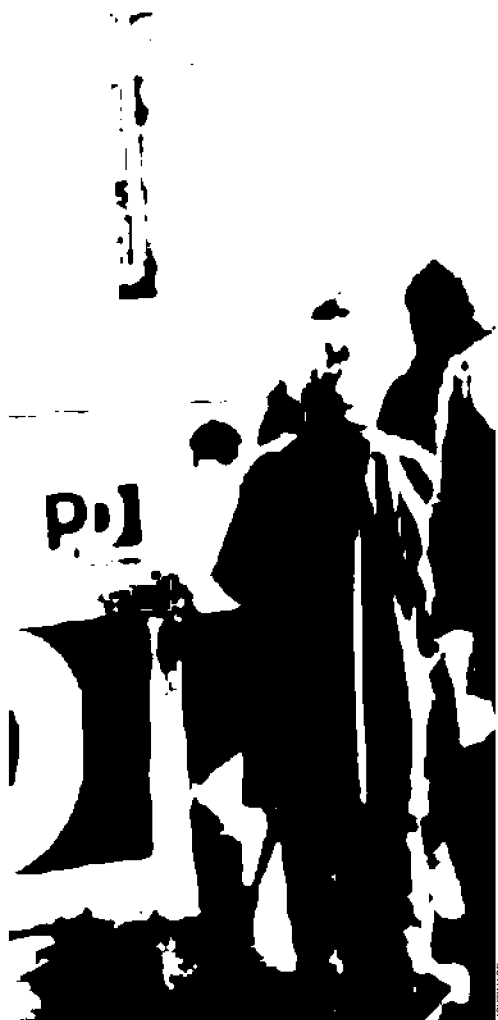
Un seggio per le recenti primarie del Pd: la consultazione per il candidato sindaco slitta ancora